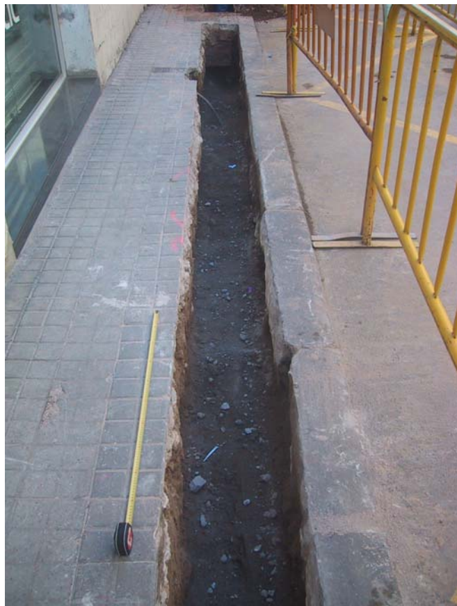
F 1. Rasa 1000. C/ D'Ortigosa Finalitzada