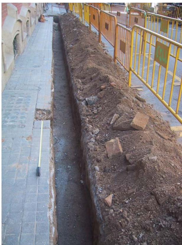
F 2. Rasa 1000. C/ D'Ortigosa Finalizada