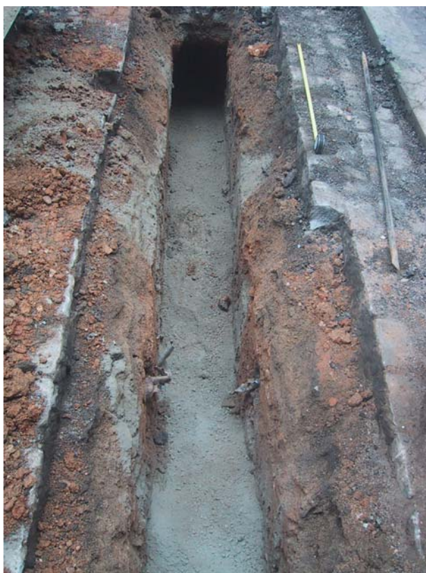
F 4. Rasa 2000. C/ D'Ortigosa. Finalitzada amb una cap da formigó en pols