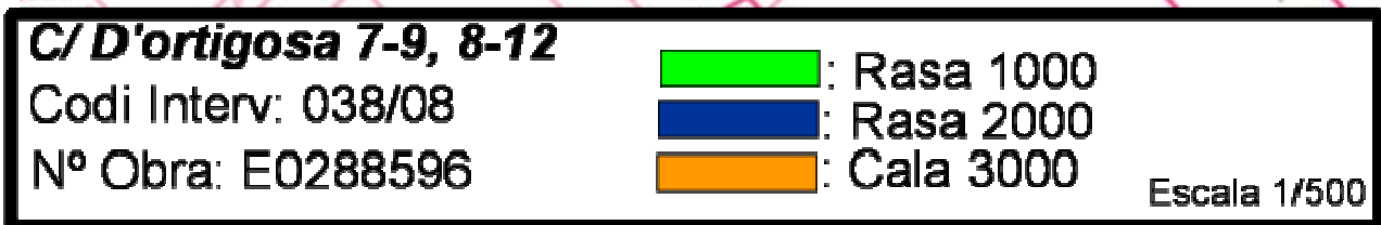
Fig 2. Plànol amb les rases efectuades situades al C/ D'Ortigosa, 7-9. Escala: 1/500