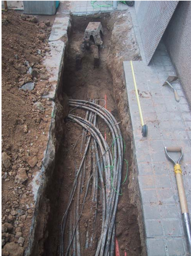
F 6. Cala 3000. C/ D'Ortigosa. Finalitzada amb tot el cablejat anterior