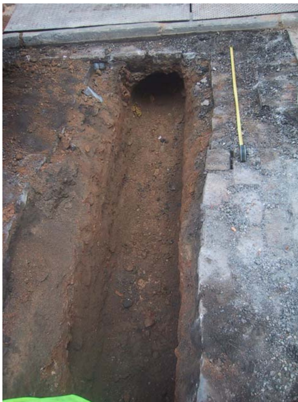
F 5. Rasa 2000. C/ D'Ortigosa. Finalitzada sense el formigó