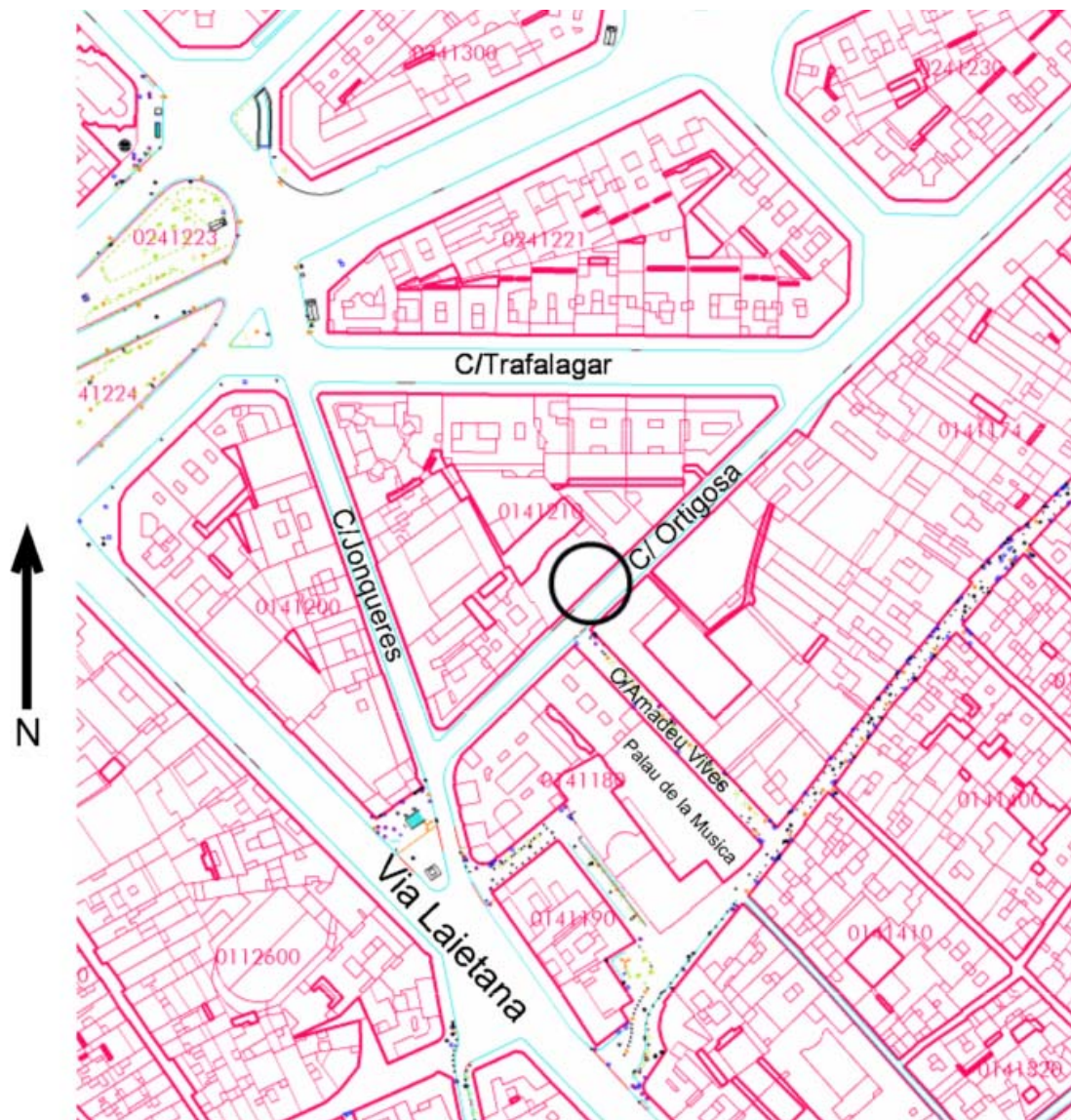
Fig 1. Plànol on es localitza la zona on es va realitzar la intervenció